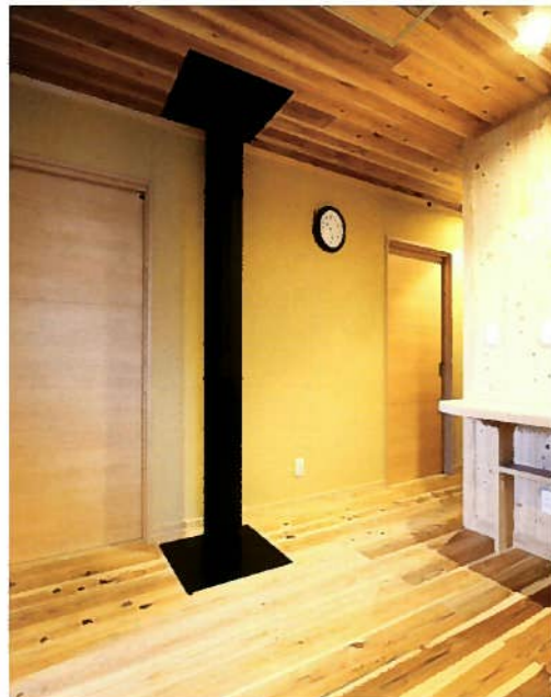
2階廊下部分にも、質感豊かなシラス壁を塗った。床と天井には無垢の木材を用いているために、爽やかな木の香りに満ちている。1階の暖炉から続く煙突は壁根まで延びていて、暖房時にはほんやりと暖かさが伝わってくる空間に仕上がった