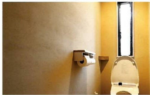
トイレにもシラス壁を使用。アンモニア臭を抑える効果を発揮している