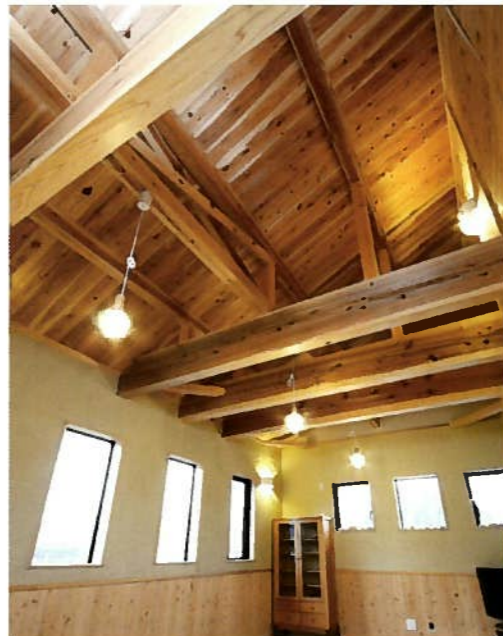
樹齢100年以上のスギなどをふんだんに用い、壁にはシラス壁を用いた2階寝室。梁には全物をほとんど使わず、クサビで組み合わせている。自然素材と昔ながらの職人技が成し遂げた空間は、明るい光が差し込むとっておきのスペースになった