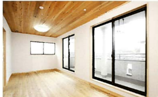
色調は部屋の雰囲気に応じて、シラス壁4種類47色の中から選んだ